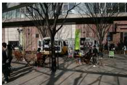
警固カフェ社会実験の様子