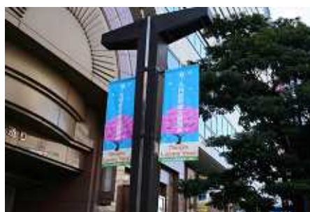
渡辺通りバナーの様子