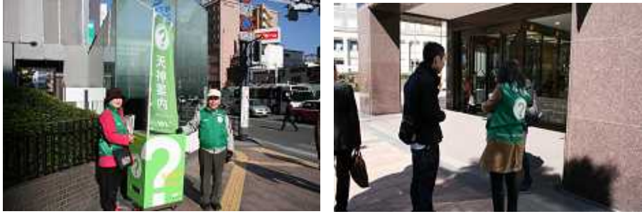
天神案内人の活動の様子