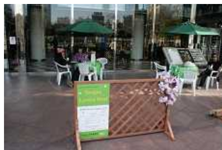
公開空地等でのオープンカフェの様子