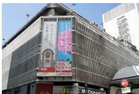
一斉懸垂幕の様子

街全体でお祝いムードを盛り上げるために、WeLove 天神協議会では、渡辺通りの街路灯にバナーを掲出。(平成 23 年 3 月 1 日 ( 火 ) ~ 31 日 ( 木 ))