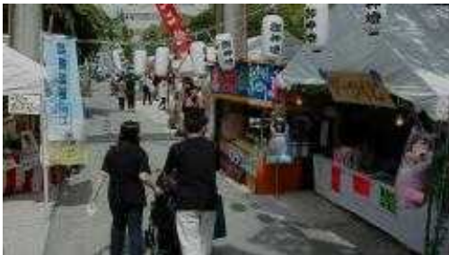
警固神社での夏越祭り

2011年に発生した東日本大震災は、大きな被害をもたらしただけでなく、私たちの生活を大きく見つめ直させるものとなりました。その一つが、「節電」。毎年、We Love天神協議会でも、ライトダウン等の環境配慮の取り組みを行ってききましたが、今夏は、「2011天神ウェルカムイヤープロジェクトin Summer」と題し、天神地区が一体となって「打ち水」などに取り組み、「節電」や「エコロジー」の機運を高めたいと考えています。