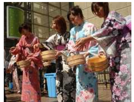
毎年実施しているイムズ前の打ち水