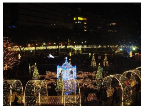
警固公園「TENJIN光のファンタジー」

メイン会場の警固公園では、恒例の水上チャペルが「屋外スケートリンク」に変身します。新たな天神のスポットで楽しいクリスマスを過ごしてください。