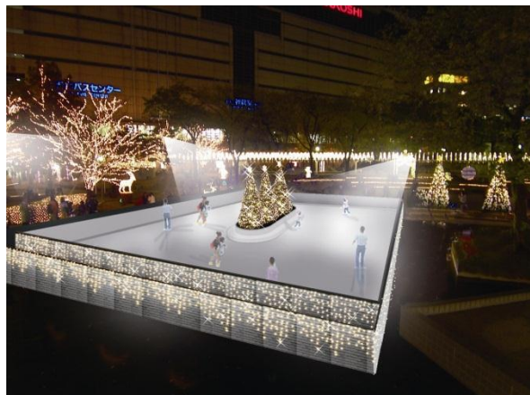
警固公園のスケートリンク(イメージ)

いよいよこの季節がやってきました。今年もやります「天神のクリスマスへ行こう2011」！天神地区一帯がクリスマスムードに包まれます。20以上のスポット(警固公園、街路樹、商業施設、オフィスビルなど)で様々なイルミネーションが灯り、楽しいイベントが盛り沢山の約1ヶ月半のイベント。