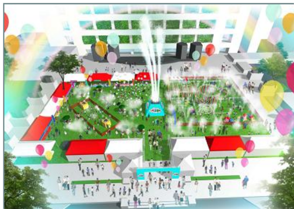
市役所前ふれあい広場が涼のテーマパークに