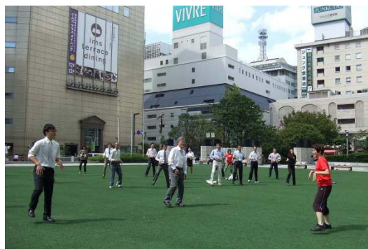
市役所前での10分ランチフィットネスの様子