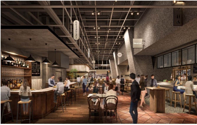
▲開放的な地下2階の商業ゾーン