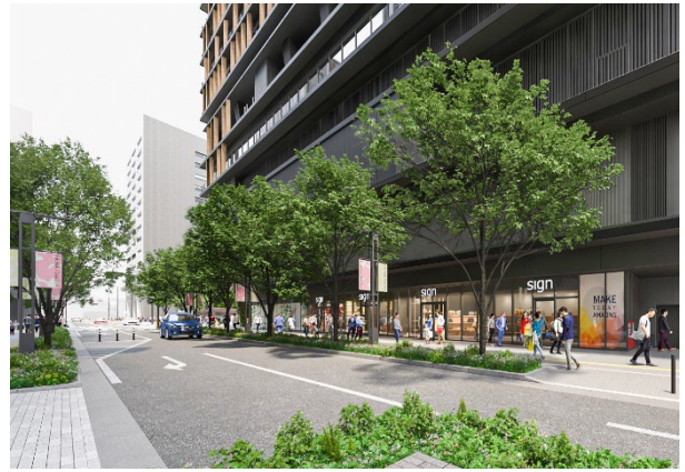
▲福博であい通りに連なるショップファサード