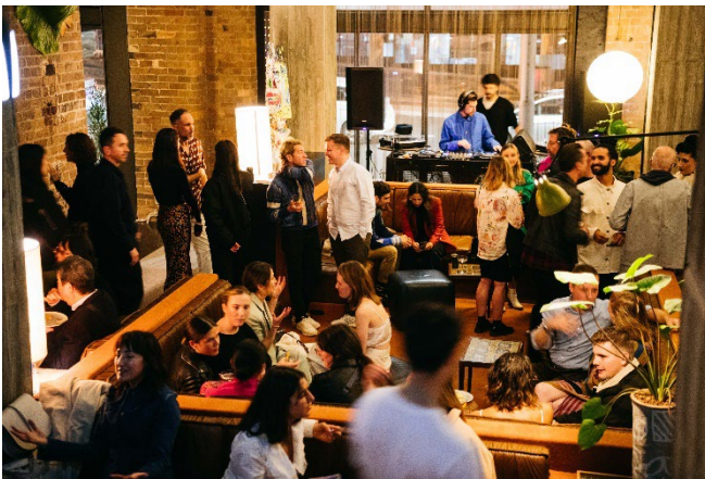
▲エースホテル・シドニーのラウンジ

アジア地域において 2 施設目かつ九州初進出となるアメリカ・シアトル発のホテルブランド「エースホテル」が出店いたします。192 室の客室に加え、1～2 階のラウンジ、カフェバー、レストラン、ギャラリー、3 階の MICE 対応が可能なファンクショナルルーム・ミーティングルーム、19～20 階のルーフトップバーは、宿泊者以外にも来街者やワーカーなどまちに関わる人々が自由にご利用いただけます。また、アートや音楽などの文化的プログラムの展開などを通じ地域コミュニティの活性化・カルチャー創出を目指します。