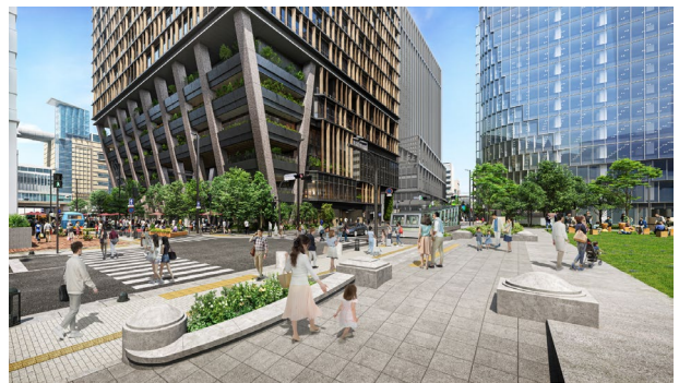
▲来街者が行き交う西側（ふれあい広場側）空間