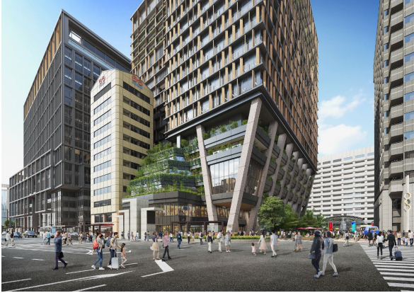
▲オフィスエントランス吹き抜け部（渡辺通りより）

総面積約 8,000 坪、基準階面積約 790 坪、想定就業者数約 3,000 人のオフィス空間を整備いたします。レイアウト効率が高く様々な働き方に対応できる無柱空間となる本計画のオフィスは、最小区画 30 坪台からのご利用が可能であり、三菱地所が 2018 年の本社移転以来培ってきた「進化し続けるワークプレイス×ワークスタイル」に関する知見やノウハウも踏まえた提案をしております。渡辺通りから視認できる 3 階角部には、様々なワークスタイルに寄り添うカフェを併設した一部 2 層吹き抜けのオフィスエントランスを設けるなど、天神のあらたなランドマークとなるオフィスが誕生します。