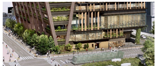
▲建物低層部に広がる緑地