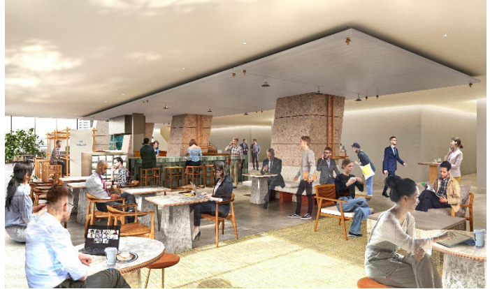
▲オフィスエントランス内部