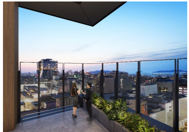
▲ルーフトップバーからの眺望（20 階）