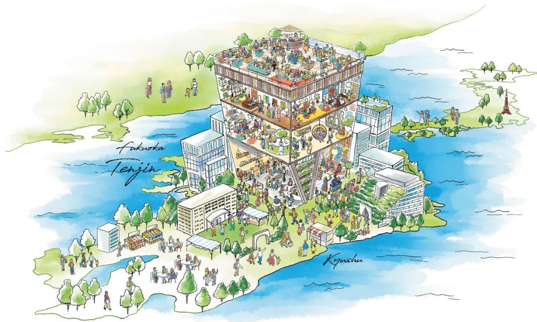
▲コンセプトイメージ

エースホテルをはじめ様々なパートナーとの共同により、本計画を通じて人々の営みがシームレスに繋がることで、本計画は、福岡市が推進する天神ビッグバン ※3 、そして福岡・天神のまちづくりに貢献してまいります。