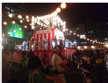
昨年の様子：2018年8月3.4.5日

タイトル 天神夏まつり2019 開催期間 2019年8月2日(金)から8月4日(日)3日間 開催場所 福岡市役所西側ふれあい広場 内容 天神打ち水大作戦・盆踊り・音楽ライブ・お楽しみ抽選会他(予定) 共催 We Love 天神協議会・福岡市 協力 大名自治協議会