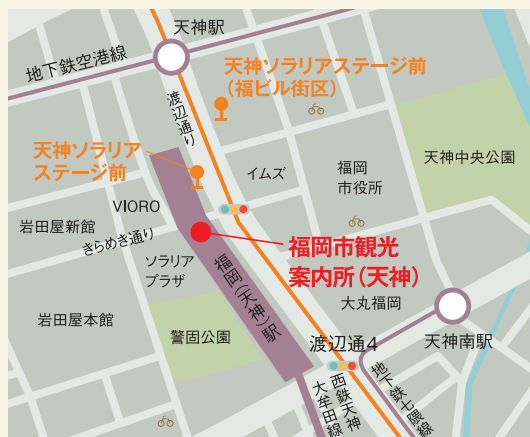
● 都心循環BRTバス停 ○ シェアサイクルポート

● 注意事項：観光案内所で駐車券の割引処理が必要です。実証実験除外日がありますので、詳細はホームページでご確認を