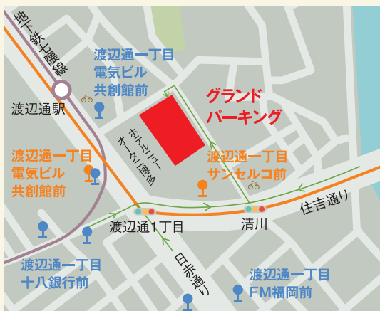
● 都心循環BRTバス停 ● 路線バス停 ○ シェアサイクルポート