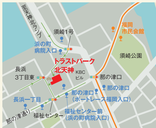
● 都心循環BRTバス停 ● 路線バス停 ○ シェアサイクルポート