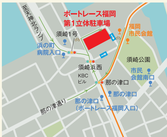
● 都心循環BRTバス停 ● 路線バス停 ○ シェアサイクルポート